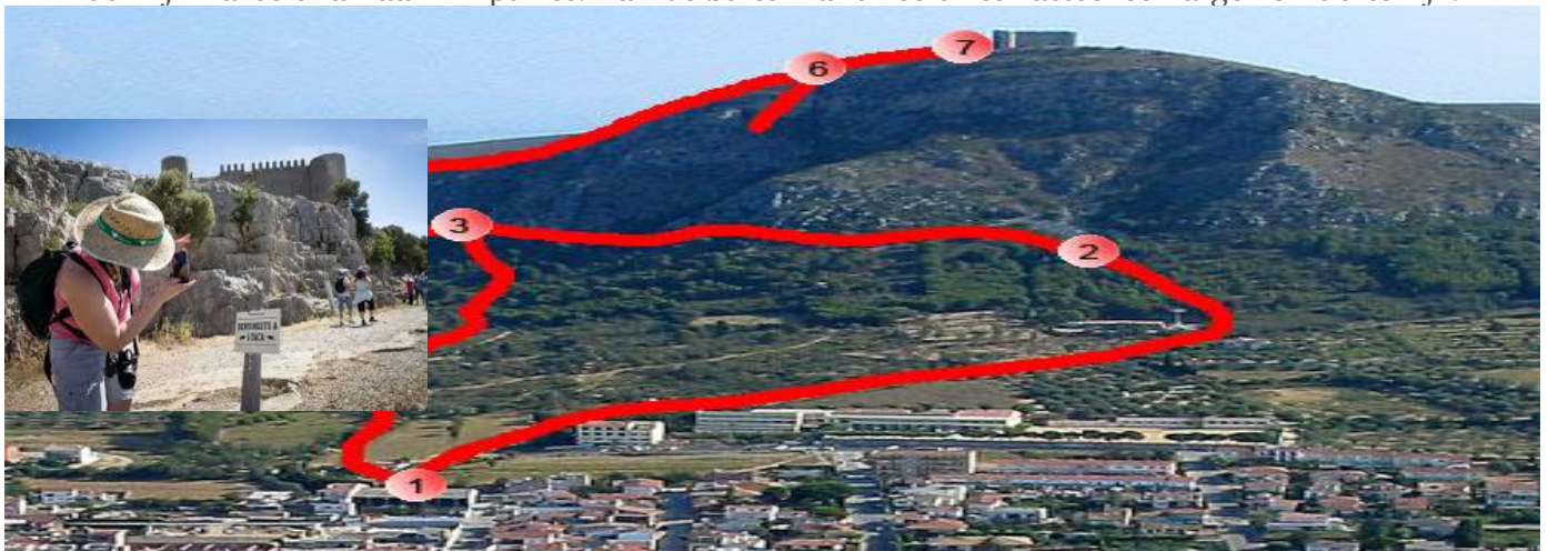
Vom Dorf Torroella de Montgrí bis zur Burg Montgrí

Het werd gebouwd tussen 1294 en 1304 door koning James II op de berg met dezelfde naam. Het werd gebouwd door het graafschap Barcelona als een achtertuin tegen het graafschap Empúries, geleid door de graaf van Ponce. Het interieur van het gebouw werd echter niet voltooid vanwege de definitieve regeling van de wijk Barcelona naar Empúries. Aan de buitenkant heeft het kasteel een afgewerkt uiterlijk.